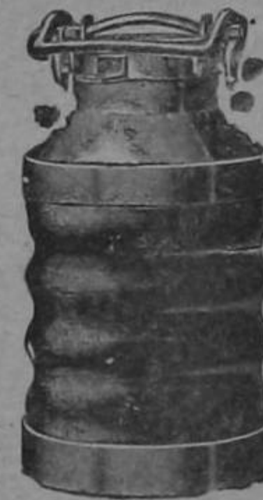
pinturas Alabastin etc.

CATRES Americanos grandes y pequeños. Felpudos Mangueras alambradas.