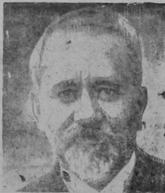
PARÍS.—El doctor Calmette, que acaba de descubrir una nueva vacuna contra la tuberculosis

Se acordó vaya a Madrid una comisión, que celebrará una Asamblea en el próximo día 9 en la Asociación de Agricultores de España, y expone luego al Gobierno los perjuicios que puede irrogar la importación del azúcar.